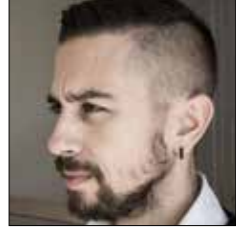
Argun Tanrıverdi Endüstriyel Tasarımı Bölümü // Dept. of Industrial Design