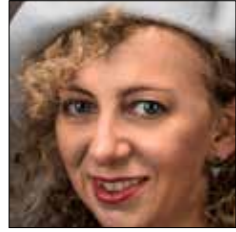
Şölen Kipöz Moda ve Tekstil Tasarımı Bölümü // Dept. of Fashion and Textile Design